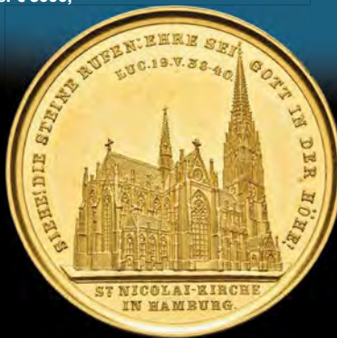
HAMBURG, STADT Goldportugaleser zu 10 Dukaten 1863 von Speckter/Lorenz a. d. Einweihung der Nikolaikirche nach Wiederaufbau, vz-st. Schätzpreis: 2600,-