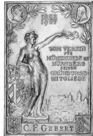
Die Plakette aus dem Jahr 1907, mit der der Vereinsgründer Carl Friedrich Gebert für 25-jährige Mitgliedschaft geehrt wurde, ist ein Unikat (Erlanger 720). Sie konnte 2017 für die Nürnberger Vereinessammlung erworben werden.

seiner Mitgliederversammlung verschiedene Sparmaßnahmen. U. a. wurde beschlossen, in jeder der folgenden Sitzungen einen Teil der vereinseigenen Münzen- und Medaillensammlung an die anwesenden Mitglieder mit folgender Einschränkung zu versteigern: „ Stücke, die auf die Geschichte u. die Geschicke uns. Vereins Bezug haben, bleiben in der Vereinessammlung. “ Auch wenn längst keine Notverkäufe mehr nötig sind, gilt diese Maxime unverändert bis heute. In den folgenden 100 Jahren wurde die verbliebene Sammlung erhalten und Stück für Stück ergänzt. Bedeutende Neuerwerbungen gelangen im Jahr 2017, als in Stuttgart eine hochinteressante Nürnberg-Sammlung mit dem Schwerpunkt Medaillen versteigert wurde. Inzwischen ist die vereinseigene Sammlung als Dauerleihgabe des Vereins im Münzkabinett des Germanischen Nationalmuseums deponiert. Dort kann sie nach Voranmeldung von jedermann im Studiensaal eingesehen werden. Das Germanische Nationalmuseum hat, mit wenigen urheberrechtlich bedingten Ausnahmen, professionelle Fotos der Stücke erstellt. Diese sind jetzt auch im Inter-