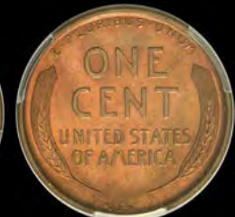
VEREINIGTE STAATEN VON AMERIKA Cent 1909-S VDB. San Francisco. Prachtex., sehr selten, PCGS MS65+ RB Schätzpreis: € 3200,-

Unsere 104. Auktion findet vom 20. bis 24. November 2023 online statt! Eine Vorbesichtigung der Lose ist nach Terminabsprache bis zum 17. November möglich. Sie möchten den Katalog per Post erhalten? Kontaktieren Sie uns telefonisch oder schreiben Sie uns!