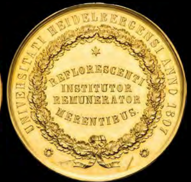
BADEN-DURLACH Karl Friedrich, Goldmed. 1807 (1833) der Universität Heidelberg, vz-st. Schätzpreis: € 2650,-