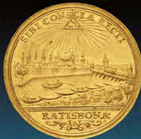
REGENSBURG, STADT Breiter Dukats o. J. (1745-1765) mit Titel Franz I. Prachtex. mit feiner Goldpatina, f. st Schätzpreis: € 3000,-