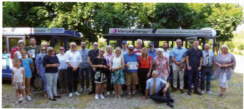
Der Nibelungenexpress brachte die Münzhändler und ihre Familien zum Museum rund ums Geld.

Das „Museum rund ums Geld“ wurde vom Geldgeschichtlichen Verein Niederrhein e.V. konzipiert und am Weltspartag 2016 eröffnet. Der Verband der Deutschen Münzhändler hatte auf seiner Mitgliederversammlung am 17. Juni 2023 beschlossen, dem Geldgeschichtlichen Verein Niederrhein e.V. eine Spende über 2000 Euro für das Museum zukommen zu lassen, die inzwischen überreicht wurde – das war in der MünzenRevue 9/2023 falsch berichtet worden.