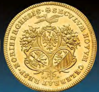
NÜRNBERG, STADT Doppeldukat 1700. Prachtex., vz-st Schätzpreis: € 2800,-