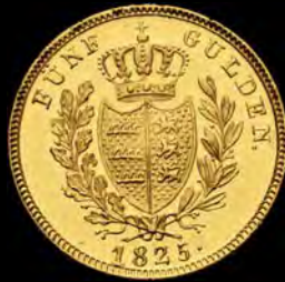
WÜRTEMBERG Wilhelm I., 5 Gulden 1825, vz-st. Schätzpreis: € 1250,-